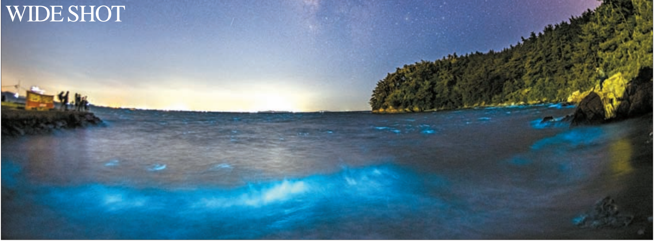
반짝이는 바다의 오로라 전남 깊은 밤 하늘에는 은하수가 흐르고, 바다에는 푸른 빛으로 반짝이는 파도가 오로라인양 일렁인다. 충남 서천 월하리의 해변이 만조시간이 가까워지자 푸른 빛으로 물들었다. 학명은 Noctiluca scintillans, 한국에서 야광충이라고 불리는 해양 플랑크톤 때문이다. 야광충은 물리적인 자극을 받으면 푸른 빛을 내는데 반딧불이와 같이 루시페린을 통한 생체 발광이다. 사진·글=최기웅 기자