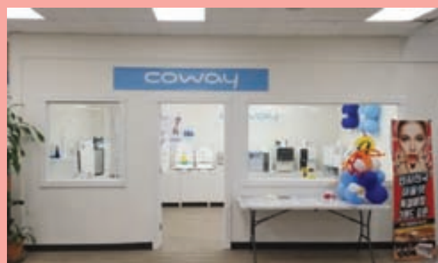
베세토 지하 1층 822 N Rolling Rd, Catonsville, MD, 21228