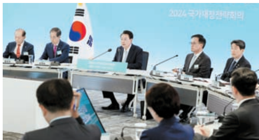
윤석열 대통령(가운데)이 17일 오후 세종특별자치시 정부세종청사에서 열린 2024년 국가재정전략회의에서 모두발언을 하고 있다. [뉴시스]

대통령실 관계자는 R&D예타 전면 폐지에 대해 “전 세계 주요 국가들이 첨단 분야에서 각축전을 벌이고 있는 상황에서 자칫 예타에 발목 잡혀 R&D가 원활하게 진행되지 않을 경우 기술 경쟁에서 밀릴 수밖에 없다는 게 윤 대통령의 생각”이라고 전했다. 현재 총사업비가 500억원(국비 300억원) 이상인 재정 사업을 진행하려면 수개월에 걸친 예타를 거쳐야 한다. 과학기술계에서는 빠른 기술 변화에 발맞춰 R&D예타 규제를 완화해야 한다는 요구가 이어져 왔다. 정부는 올해 삭감됐던