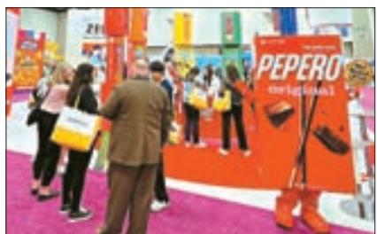
롯데웰푸드가 스위트 앤드 스낵 엑스포에서 빼빼로와 제로를 소개했다.

롯데웰푸드가 14~16일 인디애나주 인디애나 컨벤션센터에서 열린 '스윗 앤드 스낵 엑스포'에 참가했다고 16일 밝혔다.