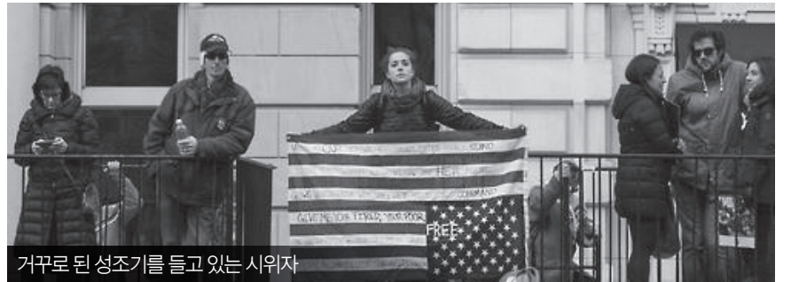
거꾸로 된 성조기를 들고 있는 시위자

대선 무렵 이 동네의 한 가족이 옥실 이 담긴 반트럼프 팻말을 집 앞에 내걸었고, 이 문제로 알리토 부인이 그 가족과 갈등을 빚었다고 NYT는 전했다. 다만, 이웃들은 갈등이 있었다고 해도 거꾸로 된 성조기의 상징과 1·6 의회 폭동이 이뤄진 이후라는 시기를 감안할 때 알리토 부부가 그런 국기를 게양한 행위는 '정치적 발언'이었다고 해석했다. 대법원은 앞으로 몇 주 안에 '1·6 의회 폭동'과 관련해 트럼프 전 대통령에게 면책 특권이 있는지 등 중요한 판결을 할 예정으로, NYT의 이번 보도로 알리토 대법관의 공정성을 두고 논란이 일 전망이다. 트럼프 전 대통령은 폭동을 부추긴 혐의로 기소된 상태다. 사법 전문가들은 거꾸로 된 성조기는 편향된 모습을 보이지 않아야 한다는 법관 윤리 규정을 명백히 위반한 것이라고 지적했다고 NYT는 전했다. 버지니아대 법학 교수 야만다 프로스트는 "(게양한 사람은) 배우자나 집에 사는 다른 사람일 수도 있지만, 그 (알리토 대법관)는 세상에 내보내는 메시지로써 그것을 마당에 게시해서는 안됐다"며 판결할 때 문제가 될 수 있다고 지적했다.