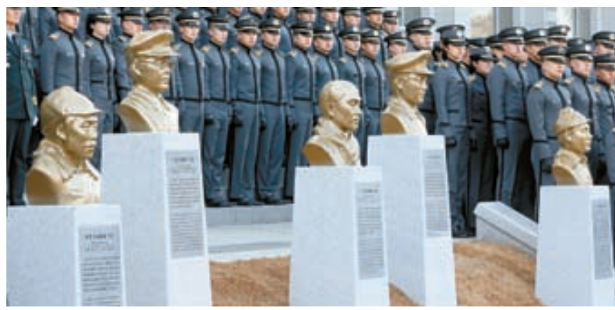
2018년 3월 1일 서울 노원구 육군사관학교에서 열린 독립전쟁 영웅 5인 흉상 제막식 모습. 왼쪽부터 홍범도·지청천 장군, 이회영 선생, 이범석·김좌진 장군 흉상.

구체적인 사안별 비판도 이어갔다. 지난해 ‘새만금 잼버리 사태’를 2018년