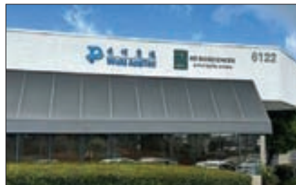
사진은 국내에 있는 중국 바이오기업 우시애펙.

연방 의회가 특정 중국 바이오기업들과 자국 기업의 거래를 제한하는 법안이 연방 상원 상임위에 이어 하원 상임위에서도 통과됐다. 조 바이든 행정부가 중국산 전기차에 100% 관세 부과를 결정한 데 이어 의회도 대중 공세 수위를 끌어 올리는 모양새다.