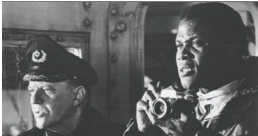
‘베드포드 사건’(1965)은 핵과 3차 세계대전에 대한 공포감이 지배하던 시대에 발표됐다. 정치가들의 인류 평화에 대한 진정성에 의문을 제기했다.