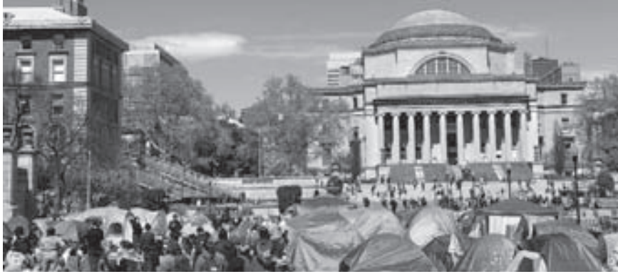
25일 뉴욕 컬럼비아대 캠퍼스에서 가자 전쟁을 반대하는 학생들이 텐트를 치고 농성을 벌이고 있다.

미국 대학가를 휩쓰는 친(親)팔레스타인 반전시위의 진영으로 꼽히는 뉴욕 컬럼비아대학에서 네마트 미노슈 사피크 총장에 대한 불신임안이 통과됐다. 영국 일간 더타임스와 미국 매체 약시오스 등은 16일 컬럼비아대 인문과 학부 교직원 투표에서 사피크 총장에 대한 불신임 결의안이 가결됐다고 보도했다. 이들 외신에 따르면 투표에 참여한 컬럼비아대 인문학부 교수 등 709명 가운데 65%가 불신임안에 찬성했고, 반대표는 29%에 그쳤다. 6%는 기권했다. 앞서 미국대학교수협회(AAUP) 컬럼비아대 지부는 사피크 총장이 학문의 자유라는 기본 요건을 침해하고 학생들의 권리를 전혀 없이 침해했다며 불신임 결의안을 발의한 바 있다. 이후 교수와 교직원, 학생 111명으로 구성된 컬럼비아 대학평의회 (University Senate)가 해당 결의안을