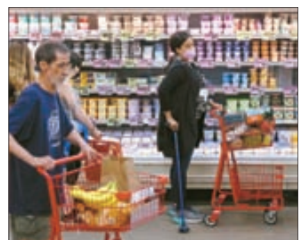
식료품 물가가 모처럼 내렸다. 고객들이 그로서리스토어에서 장을 보고 있다.