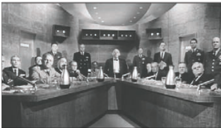
헨리 폰다 주연의 ‘페일 세이프’(1964)는 버튼 하나로 도시를 파멸시킬 수 있는 핵무기의 위력과 핵전쟁의 위험을 실감케 하는 영화였다.

‘페일 세이프(Fail-Safe)’ ‘베드포드 사건 (The Bedford Incident)’ ‘폴아웃(Fallout)’