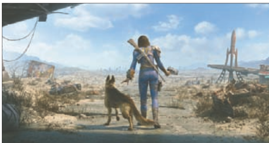
TV 드라마 ‘폴아웃(Fallout)’은 2296년 핵전쟁의 여파를 배경으로 핵이 지구를 뒤덮은 미래의 참혹상을 ‘미리’ 경험하게 한다.

냉전 이후 사라지는 듯했던 핵무기 공포가 최근 다시 살아나고 있다. 러시아는 우크라이나 전황이 불리할 때면 핵무기 사용을 언급하고 있다. 블라디미르 푸틴 러시아 대통령은 선거 기간인 지난 3월에도 “핵무기는 항상 전투 준비 태세에 있다”고 공개적으로 핵무기 사용 가능성을 열어 놓았다. 한반도에서도 핵 위협은 더 커졌다. 지난 1월 로버트 갈루치 조지타운대 명예교수는 외교안보 전문지 ‘내셔널 인터레스트’ 기고문에서 “2024년 동북아시아에서 핵전쟁이 일어날 수 있다는 생각을 최소한 염두에는 두어야 한다”고 밝혔다. 도널드 트럼프 전 대통령이 재선될 경우 백악관 국가안보보좌관 후보로 거론되는 엘브리지 콜비 전 국방부 전략·전략 개발 담당 부차관보는 지난 6일 “한국의 핵 무장을 배제하지 않는다”는 발언까지 했다.