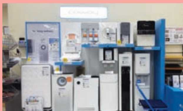
센터빌 롯데 5900 Centerville Crest Ln, Centerville, VA 20121