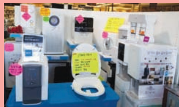
센터빌 H MART 13818 Braddock Rd, Centerville, VA 20121