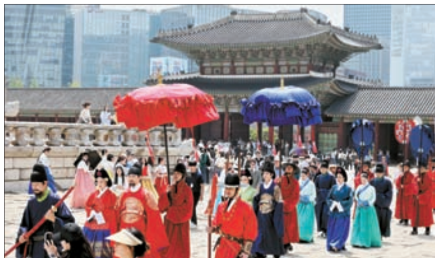
국가유산청 출범 기념 '왕가의 산책' 17일 서울 경복궁에서 특별행사 '왕가의 산책'이 펼쳐지고 있다. 이날 시행된 국가유산기본법에 따라 문화재청을 대신할 국가유산청 출범을 기념하는 행사다. 지금까지 법률·행정 용어로 사용돼온 '문화재' 단어는 '국가유산'으로 대체된다.

혐의를 적용한다는 게 공정위의 방침이다. 다만 A뺑집 운영사는 본지에 "뒷광고를 한 적도, 뒷광고를 하게 한 적도 없다"며 "우리 회사와 B사는 아무런 관계가 없다"고 해명했다. B사도 같은 입장을 내놓았다. 공정위는 B사가 A뺑집 운영사뿐만 아니라 수십 개 이상의 광고주를 모아 인플루언서를 활용한 뒷광고를 해왔다는 의혹을 잡고 조사를 확대하고 있다. 다른 유명 뺑집과 카페, 닭 요리 전문점 등이 연루된 것으로 알려졌다. 공정위는 또 B사 외에도 관련 의혹이 불거진 다른 광고대행사에 대해서도 조사를 확대할 방침이다. 세종=김민중 기자