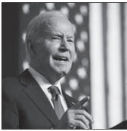
조 바이든 대통령이 8일 위스콘신주 스타터번트의 게이트웨이 테크니컬 대학에서 연설하고 있다. (스타터번트 AFP·연합뉴스)

조 바이든 대통령이 오는 11월 대선 승리를 위해 경합주 중에서도 미시간, 펜실베이니아, 위스콘신 3개 주에 더 많은 시간과 역량을 쏟아부었다고 한다. 이들 3개 주는 과거 부흥을 이끈 철강, 자동차 등 제조업이 쇠락하면서 '러스트 벨트'로 묶인 지역이다. 이 지역은 과거 선거에서 늘 민주당을 지지해 '블루월'(Blue Wall·과관 장벽)으로도 불렸다. 경제 침체에 실망한 유권자들이 2016년 대선에서 대거 민주당에 등을 돌린 바 있지만, 2020년 대선 때 바이든 대통령이 탈환에 성공하며 당선됐다. 대선 승패를 사실상 좌우하는 7개 경합주 가운데 '선벨트' 조지아주와 노스캐롤라이나주, 서부의 애리조나주와 네바다주에서 각종 여론조사 결과, 상대인 도널드 트럼프 전 대통령보다 열세인 탓에 바이든 대통령으로서 불루장벽 사수를 재선을 위한 핵심 전략으로 삼고 있는 것이다. WP는 선벨트와 서부 지역에서 고전하고 있는 바이든이 블루월 요새화를 시도하는데 사활을 걸고 있다고 보도했다. 올해 들어 바이든 대통령이 이들 3개 주를 방문한 날은 14일이나 된다. 바이든 대통령은 오는 19일에도 미시간주 최대 도시 디트로이트를 찾아 미국 흑인 인권운동단체 '전미유색인종지위향상협회'(NAACP) 디트로이트 지부에서 연설할 예정이다. 트럼프 전 대통령보다 훨씬 더 많은 선거 자금을 모금한 바이든 캠프는 이