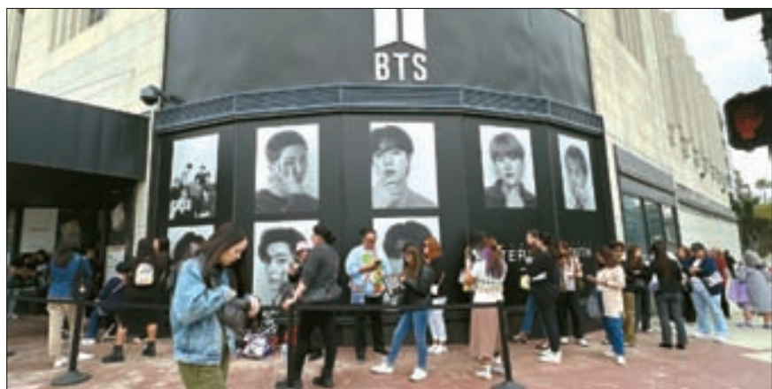
BTS 팝업 LA에 등장 그룹 방탄소년단(BTS)이 팝업 스토어가 26일 한국문화원 인근에 문을 열었다. 빅 히트 뮤직 측은 현재 7명의 멤버 전원이 군 복무 중으로 전 세계 BTS 팬들에게 추억을 선물한다는 의미로 전 세계 6개국 6개 도시에서 개최한다고 밝혔다. LA의 스토어는 오늘 27일까지 오픈한다. 주소는 5522 Wilshire Blvd. 김상진 기자

때문에 일각에선 미국 바이오 기업들의 공급망 전환이 순조롭게 이뤄지지 않을 경우 국내 의약품 수급에 차질이 빚어질 수 있다고 우려한다. 동시에 한국 바이오 기업이 중국 대체 기업으로 떠오르며 중장기적으로 반사이익을 얻을 것이란 관측도 나온다. 임성영 기자