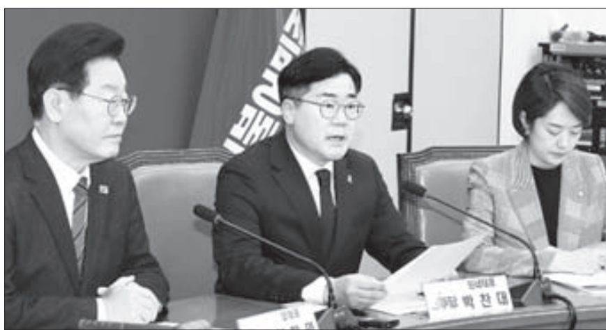
박찬대 더불어민주당 원내대표가 17일 오전 열린 최고위원회에서 발언하고 있다. 왼쪽부터 이재명 대표, 박 원내대표, 고민정 최고위원. [연합뉴스]

정, 경선 직후 ‘추미에 탈락’ 비판 글 우 “부적절한 갈라치기” 거듭 반박 이재명 팬카페 “반역” 잇단 분노 글 “추미에 안 뽑은 90명 또 뒤통수 칠 것”