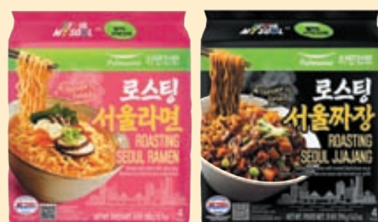
Roasting Seoul Ramen (13.7 oz), Roasting Seoul Jjajang (14 oz) 서울라면, 서울짜장