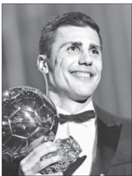
2024 발롱도르 트로피를 안은 맨체스터시티의 로드리. 로드리 수상으로 '메시-호날두 시대'는 막을 내렸다.