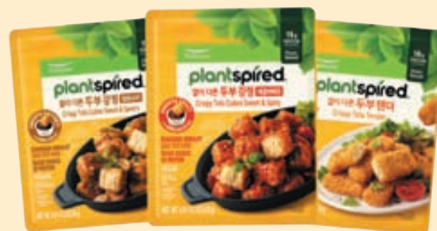
Crispy Tofu Cubes Sweet & Savory (14 oz), Sweet & Spicy (14 oz), Tender (14.1 oz) 두부 강정 달콤소이, 매콤바베큐, 두부 텐더