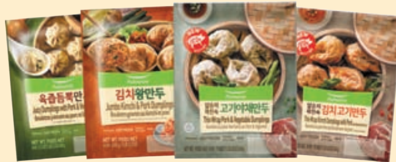
Juicy (21.2 oz), Kimchi Jumbo (22.2 oz), Thin Wrap Dumplings (19.8 oz), 육즙떡만두, 김치왕만두, 얇은피고기만두 (아채, 김치)