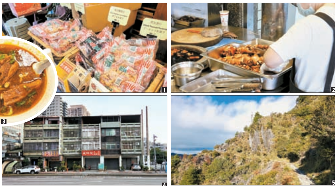
1 쫄깃한 식감이 매력적인 '진르미마화'의 꿀 파배기. 2 대만에서도 족발을 즐겨 먹는다. 한국과 달리 부위 별로 골라 살 수 있다. 3 한국인 관광객에게도 인기 높은 우육면. 4 타이중에서 흔히 볼 수 있는 4층 규모의 주상 복합 건물, 우리의 숙소도 이 중 하나였다. 5 3952m 높이의 옥산에 오르려면 최소 2박 3일 일정은 잡아야 한다. 인프라가 잘 돼 있어 고산병만 주의하면 어렵지 않게 오를 수 있다. 비가 들한 10~2월이 등반하기 좋다.