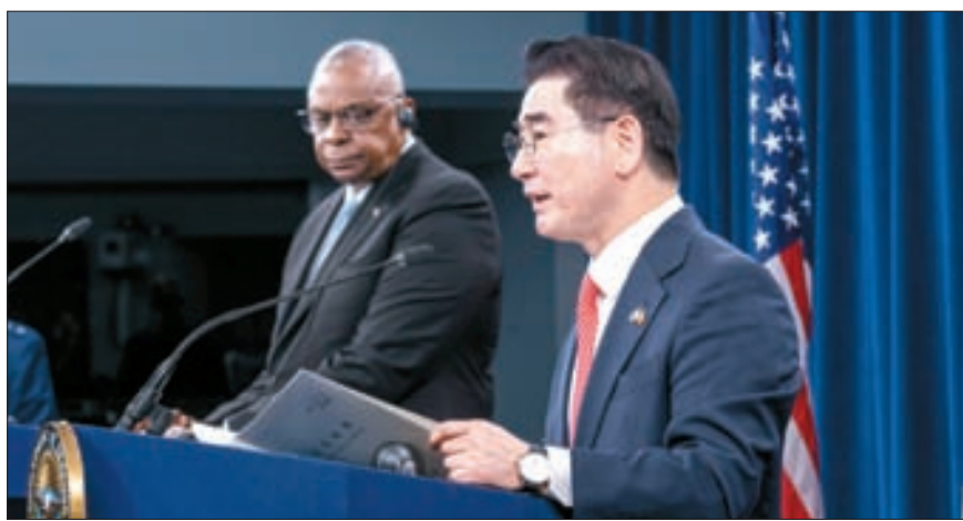
지난달 30일 한·미 안보협의회의(SCM) 기자회견을 하는 김용현 국방장관(오른쪽)과 로이드 오스틴 미 국방장관.

“북 비핵화보다 핵 억제가 현실적” 미국 정부 안팎 회의론 작용한 듯 전문가 “동맹의 중요목표 흔들려” 한국 정부 “비핵화목표 견고” 해명