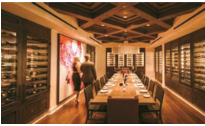
오하이 대표 식당인 올리벨라 와인룸 전경.

오하이(Ojai) 오하이는 독특하고 편안한 분위기를 자랑하는 캘리포니아의 숨겨진 보석같은 마을이다. 특히 LA에서 당일치기로 다녀올 수 있을 만큼 가깝다 보니 바쁜 도시 생활에서 벗어나 휴식을 원하는 앤젤리노들이 많이 찾는 곳이기도 하다. LA에서 차로 약 1시간 30분 정도면 갈 수 있는 오하이는 작은 타운과 고즈넉한 자연 풍경이 절묘하게 어우러진 독특한 분위기로 안가본 사람이 있어도 한 번만 가본 사람은 없는 마성의 도시다. 캘리포니아의 또 다른 매력을 간직한 이 소도시에서는 특별히 뭘 계획하지 않고 그저 걷고, 먹고, 마시고, 멍 때리는 것만으로도 온전한 휴식을 누릴 수 있다.