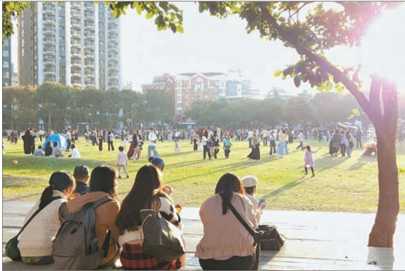
도심 속 오아시스 같은 타이중 시민공원. 우리네 한강공원처럼 시민의 휴식처로 사랑받는 장소다. 공원 주변으로 맛집과 근사한 카페가 즐비해 있다.

족발집 옆에는 '진르미마화(今日蜜麻花之家)'라는 이름의 전통 꿀 파배기 가