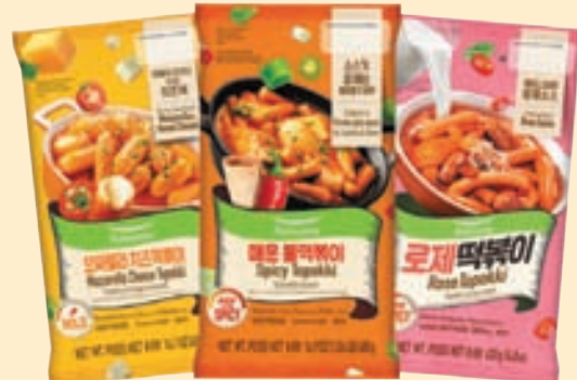
Mozzarella (12.7 oz), Spicy (16.9 oz), Rose Topokki (14.8 oz) 모짜렐라 치즈, 매운떡볶이, 로제떡볶이