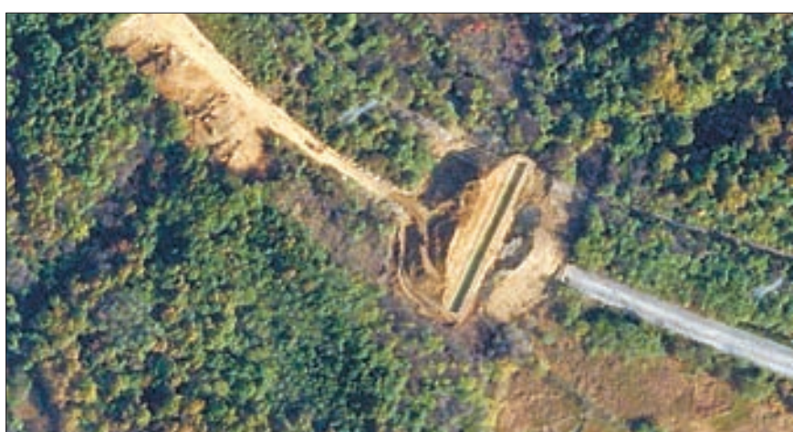
북, 경의선-동해선 방벽 설치 마무리 북한이 남북 경의선과 동해선 도로에서 착수한 방벽 공사가 마무리된 것으로 확인됐다. 남북 군사분계선과 맞닿은 북한 쪽 지대를 촬영한 지난달 30일자 ‘플래닛랩스’의 위성사진에는 도로 한가운데에 120m 길이의 방벽 추정 시설이 보인다.

‘우크라 무기 제공’ 전문가 시각 국방부 “우크라, 포탄 요청 안해” 전문가 “칼은 칼집에 있을 때 더 위력” 젤렌스키 “한국 방공시스템 지원을”