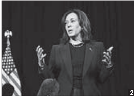
2 기자회견하는 해리스 부통령

다고 재차 강조했다. 그는 자기 스태프들이 ‘여성 보호’ 등과 같은 표현이 부적절하다면서 사용을 자제할 것을 요청했다고 거론한 뒤 “나는 ‘아니다. 나는 이 나라의 여성들을 보호할 것이다. 나는 여성들이 좋아하든 싫어하든(whether the women like it or not) 그렇게 할 것’이라고 말했다”고 전했다.