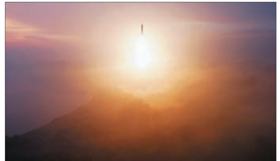
북한이 31일 오전 김정은 국무위원장 명령에 따라 대륙간탄도미사일(ICBM)을 발사했다고 조선중앙통신이 이날 보도했다.

러지는 미 대선을 의식한 측면이 다분하다. 한-미 연합훈련 작전계획을 ‘핵전쟁’ 기반으로 발전시키겠다고 밝힌 지난달 30일 한-미 안보협의회의(SCM) 결과 등도 고려했을 수 있다. 북한군의 러시아 파병에 대한 비난 여론이 높아지는 것과 관련, 주의를 분산시키려는 의도도 있어 보인다. 이처럼 다양한 측면에서 타이밍을 재 온 김정은이 선택한 카드가 신형 ICBM이라는 점에 전문가들은 주목한다. 정영교·박현주 기자 ▶ 8면 ‘ICBM’으로 이어집니다