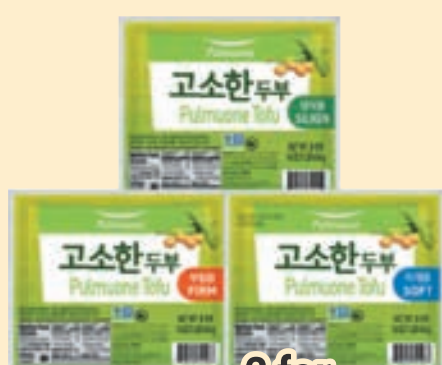
Firm, Soft, Silken Tofu (16 oz) 두부 부침용, 찌개용, 생식용