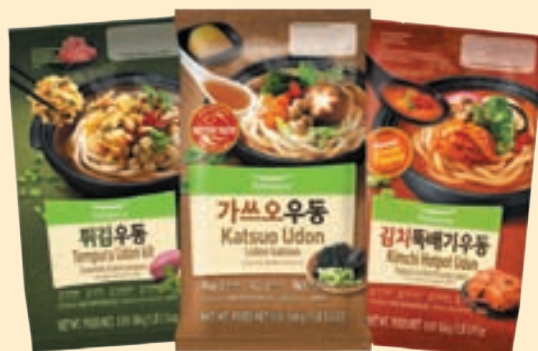
Tempura (17.14 oz), Katsuo (16.43 oz), Kimchi Hotpot Udon (19.98 oz) 튀김, 가쓰오, 김치떡볶이 우동