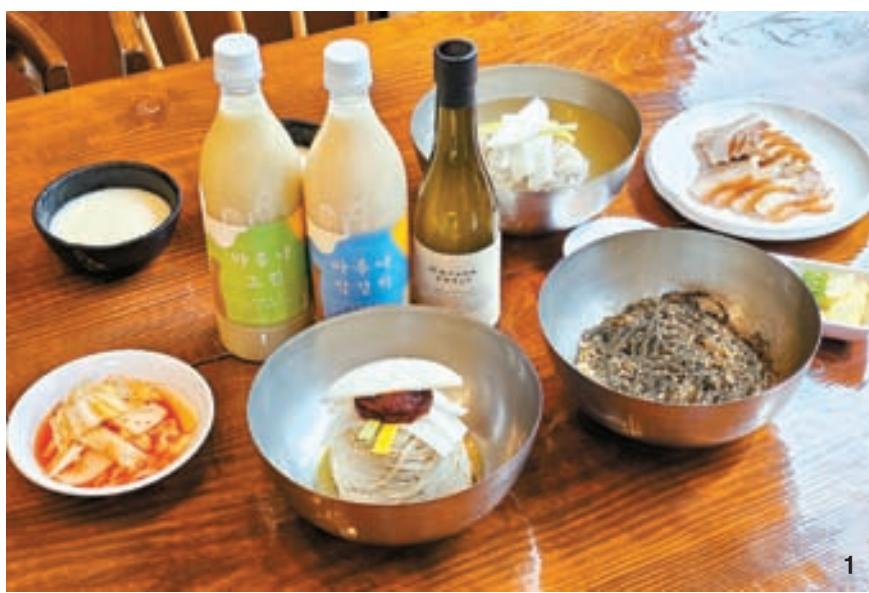
1 용인지역 맛집 '고기리막국수'에선 원래 '마루나 막걸리'를 팔지 않는다. 하지만 이 집 들기름 막국수와 잘 어울릴 것 같아 주인에게 양해를 구한 후 페어링을 시도했고, 결과는 찰떡궁합이었다. 2 '들기름 막국수' 원조집 고기리막국수. 3 용인 도심에 위치한 아토양조장.

용인 재배 쌀과 물, 누룩 등 발효제만 사용 2022년 초 연구소를 수료한 두 사람이 양조장 창업에 들어가면서 터를 잡은 곳이 지금의 경기도 용인시 동백동이다. 대형아파트 단지 인근 공원으로 이어지는 산책로 옆 카페 자리인데, 임대료도 높고 상식적으로 전통주 양조장과 어울리는 곳이 아니었다. 그런데 지나고 보니 이게 '신의 한수'였다. 동백동은 서울에 직장을 둔 젊은 부부들이 많이 거주하는 지역으로 주중에는 젊은 주부들이, 주말에는 가족이 함께 산책과 소비를 즐긴다. 아토양조장은 접근성이 좋은 산책로에 위치했고 '프리미엄 막걸리'라는, 이 지역에선 유일무이한 컨텐츠를 가졌기에 바로 주목을 끌었다. 동네 주민들이 커피를 테이크아