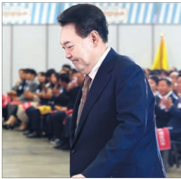
윤석열 대통령이 31일 오전 경기도 고양시 일산 킨텍스에서 열린 '2024 대한민국 소상공인대회' 개막식에 참석해 축하하기 위해 단상에서 이동하고 있다. 대통령실사진기자단

지시한 적도 없다. 당시 공천 결정권자는 이준석 당 대표, 윤상현 공천관리위원장이었다”고 밝혔다. 이어 “당시 윤 당선인과 명씨가 통화한 내용은 특별히 기억에 남을 정도로 중요한 내용이 아니었다”고 강조했다. 아울러 당시 국민의힘 대표였던 이준석 개혁신당 의원이 최근 김 전 의원 공천 정당성을 주장한 페이스북 게시물을 덧붙였 다. 이에 이 의원은 해당 페이스북 내용은 자신에 대한 해명이라며 “어디서 이준석 팔아서 변명하려고 하느냐”고 반박했다. 윤 대통령은 주요 참모와 오찬을 하며 명씨와는 대선 경선 이후 “전화도 하지 말라”며 거리를 뒀지만, 당선 축하 전화까지 거절할 수 없어 좋게 이야기하고