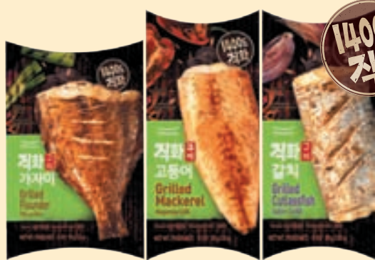
Grilled Flounder (3.2 oz), Boneless Mackerel (3 oz), Cutlassfish Fish (2.8 oz) 직화순살 고등어, 가자미, 갈치