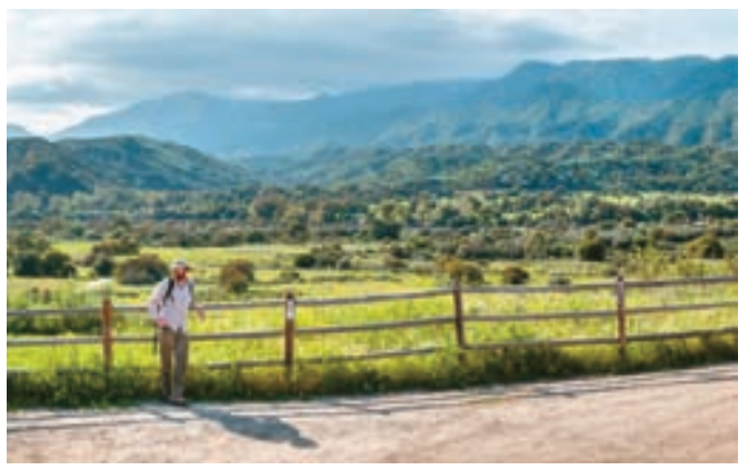
초심자도 편하게 즐길 수 있는 오하이 트레킹 코스.