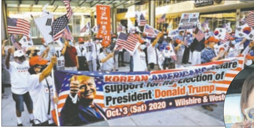
LA 한인타운 윌셔+웨스턴 길에서 열렸던 한인단체 ‘코리안 아메리칸 포 트럼프’가 주최한 트럼프 지지 시위.

주는 한인 유권자들 “트럼프 지지” 확산 ‘사이 트럼프’ 한인들도 올 대선서 ‘당당’