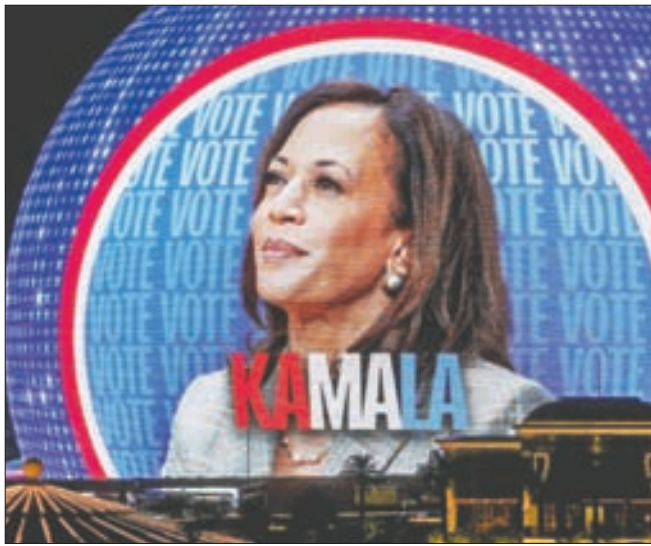
지난달 30일(현지시간) 지상 최대 광고판으로 불리는, 네바다주 라스베이거스 스피어 공연장 외부의 디지털 스크린에 실린 카말라 해리스 부통령 광고. 오른쪽 사진은 이날 위스콘신주 그린베이 유세에서 환경미화원 차림으로 쓰레기 수거 트럭을 모는 도널드 트럼프 전 대통령.

트럼프 행정부 때인 2017~2018년 한·미 FTA 개정 협상에서 미국 측 수석대표를 맡았던 그는 “트럼프가 집권 당시