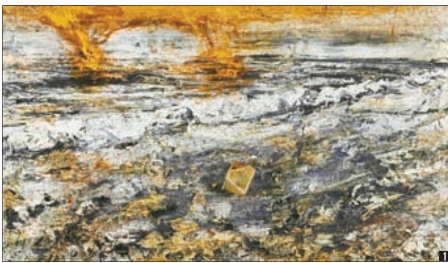
1 안젤름 키퍼의 '멜랑콜리아' 국립현대미술관 소장. 시간과 장소를 짐작하기 어려운 광활한 공간이 재난 이후의 풍경을 연상시킨다. 2 안젤름 키퍼의 '멜랑콜리아' (1990~1991), 샌프란시스코 현대미술관 소장. 비행기 동체 위에 수수께끼 같은 '뒤러의 다면체'를 올려놓았다. 3 독일의 다빈치라 불렸던 알브레히트 뒤러의 '멜랑콜리아' (1514). 그림 왼쪽 중간 부분 큼직한 물체가 미술사학과 수학자들의 관심을 불러일으킨 '뒤러의 다면체'다.

게다가 독일은 패전국일 뿐만 아니라 전범 국가였다. 그가 미술대학에 입학해 예술 활동을 시작한 1960년대는 어떤 식으로도 '독일스러움'을 드러내는 것이 금기시되는 때였다. 독일이 자랑하는 과거의 문화유산은 대체로 나치