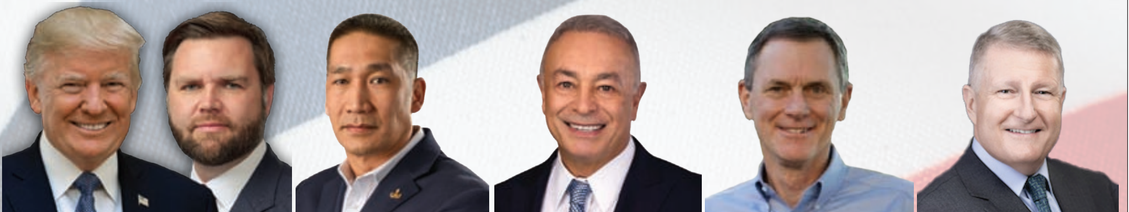
Donald TRUMP 대통령