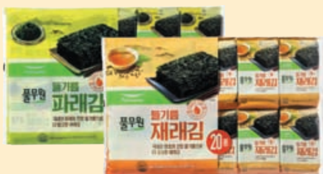
Green Laver, Perilla Seed Oil Seaweeds (3.5 oz) 들기름 파래김, 들기름 재래김 도시락김