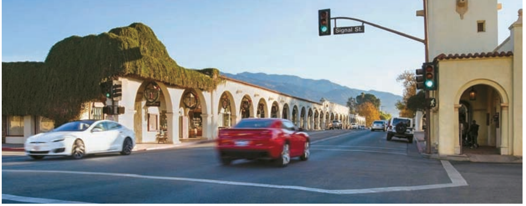
LA에서 그리 멀지 않은 오하이는 당일코스 방문해 하이킹과 명상, 쇼핑 등을 즐길 수 있는 최적의 힐링 도시다.