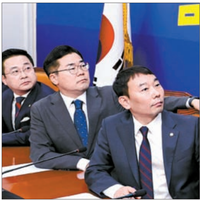
박찬대 더불어민주당 원내대표(가운데)가 31일 서울 여의도 국회에서 긴급 기자회견을 열고 윤석열 대통령과 명태균씨의 통화 내용을 확보했다며 녹취록을 공개하고 있다.

서 나한테 듣고 왔길래 내가 김영선이 경선 때도 열심히 뛰었으니까 그건 김영선이 좀 해줘라 했는데, 말이 많네 당에서"라고 말했다. 이에 명씨는 "진짜 평생 은혜를 잊지 않겠습니다. 고맙습니다"라고 답했다. 김 전 의원은 통화 다음 날인 5월 10일 경남 창원외곽 지역 국회의원 후보로 공천받았고, 6월 1일 보궐 선거에서 당선됐다.