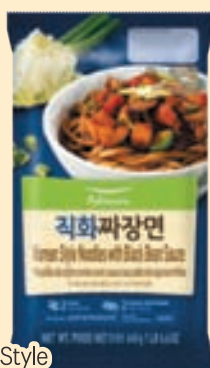
Korean Style Noodles with Black Bean Sauce (22.6 oz) 직화 짜장면