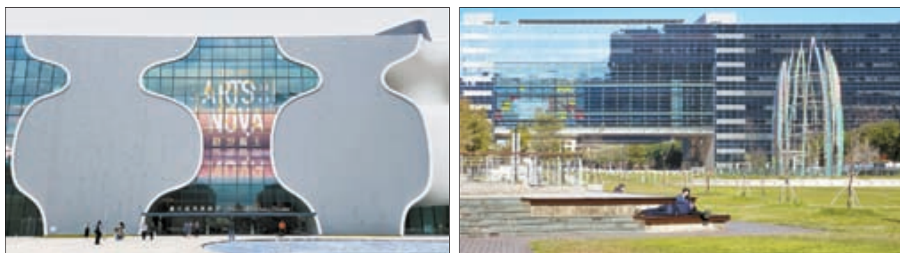
호리병 모양의 외관으로 유명한 국립극원과 칼로 자른 듯 네모뎠한 타이중 시청사. 서로 인접해 있으면서 너무 대조적이어서 더 눈길을 끈다.

게가 있다. 밀가루 반죽을 길게 뽑고, 이를 엮어 튀긴다는 점에서 우리네 파배기와 닮았지만, 큰 차이가 있었다. 도넛처럼 말랑한 식감이 특징인 한국 파배기와 달리, 진르미마화의 파배기는 쫄깃한 과자에 더 가깝게 느껴졌다. 대만 사람은 디저트의 쫄깃쫄깃한 맛을 선호하는데 그 대표적인 예가 버블티에 들어가는 경단 모양의 '쨌주(珍珠)'다. 치아에 살짝 붙을 정도의 쫄깃함을 꿀 파배기에서도 그대로 느낄 수 있었다.