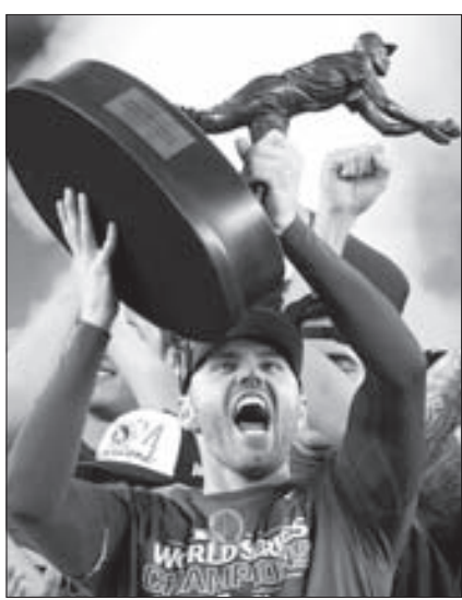
월드 시리즈 MVP 트로피를 번쩍 들어보이는 다저스 왼손 거포 프리먼.

빅리그 15년 차인 프리먼은 통산 홈런 343개를 기록하고 있는 베테랑이다. 그에게 올 시즌은 유독 힘든 한 해였다. 아들 맥시머스가 지난 7월 말 온몸에