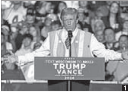
1 위스콘신서 유세하는 트럼프 전 대통령.

트럼프 전 대통령은 전날 위스콘신주의 그린베이 유세에서 불법 이민자에 의한 성폭력 등 강력 범죄 문제를 거론하면서 자신은 여성을 보호하겠