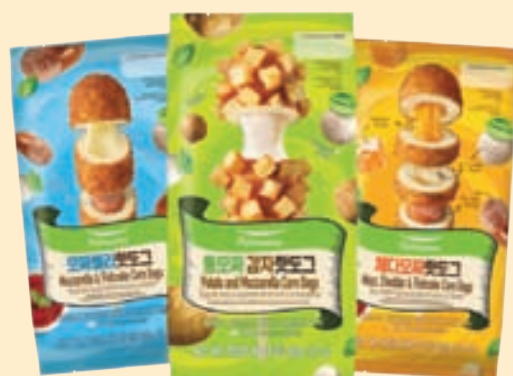
Mozzarella & Fishcake (14.1 oz), Potato & Mozzarella (12.7 oz), Cheddar Corn Dogs (17.63 oz) 모짜렐라, 통모짜김자, 체다모짜 핫도그