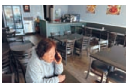
‘치킨데이’의 업주가 정전된 식당에서 지인과 통화하고 있다(왼쪽). ‘라크레센타 한국마켓’의 냉동·냉장 식품 칸이 텅 비어 있다.

이날 라크레센타의 한국 마켓의 경우 정오 이후 전력 공급이 재개됐다. 이마켓의 한 관계자는 “정전으로 냉장·냉동 식품을 다 버려야 하는 상황인데 언