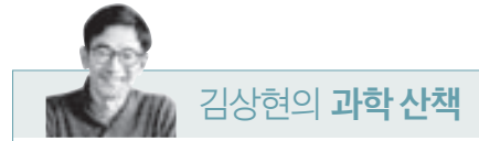
김상현의 과학 산책

이창원 총장 = 한국외대, 연세대학교 경영대학원을 졸업하고, 미 뉴욕주립대(올바니)에서 조직학 박사학위를 취득했다. 1992년부터 한성대 교수로 재직하며 기획협력처장, 산학협력단장, 교무처장 등을 역임했다. 2020년 2월 제10대 총장, 지난 2월 제11대 총장에 취임했다.