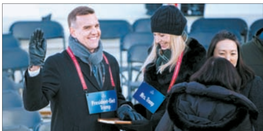
‘일 트럼프’ 트럼프 부부의 취임 선서를 대역들이 여행연습하고 있다.

전세계 초긴장 속 한국 대응은 관세전쟁 땀 성장률 최대 1.14%P↑ 한·미 FTA 재개정 등 압박 가능성