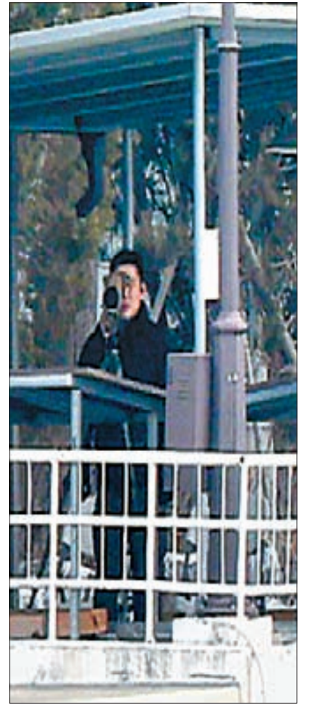
관저 밖에서, 관저 안에서 13일 서울 한남동 대통령 관저 밖 신원 미상의 사람들은 내부를 촬영하고 (왼쪽 사진), 관저 안의 경호처 관계자들은 외부 상황을 지켜보고 있다.