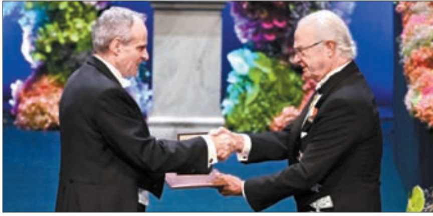
지난달 10일 존슨 교수(왼쪽)가 스웨덴 국왕으로부터 노벨상을 받고 있다.