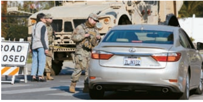
대형산불이 발생한 퍼시픽 팰리세이즈와 알타데나 지역에 절도범들이 기습을 부리자 치안 유지를 위해 주방위군까지 출동했다. LA카운티 세이프티국과 지역 경찰은 철저한 신분 확인을 통해 해당 지역 거주자 만 출입을 허용하고 있다.

또한, LA 지역 곳곳에서 단수, 정전 사태가 발생하고 있어 주민들이 불편함을 겪고 있는 것으로 나타났다. 개빈 뉴섬 주지사는 12일 행정명령을 통해 화재로 피해를 본 사람들이 집을 다시 지을 수 있는 데 제약이 없도록 환경 품질법(CEQA)의 까다로운 조항을 면