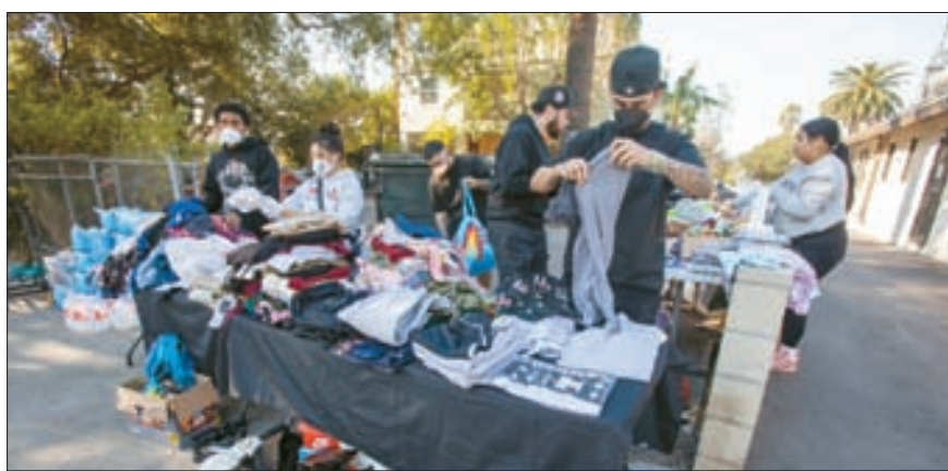
화재피해를 당하지 않은 주민들이 알타데나의 길거리에서 피해자들에게 무료로 나눠줄 옷가지 등을 정리하고 있다.