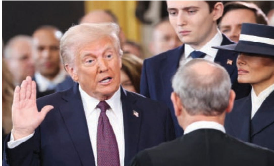
도널드 트럼프 제47대 대통령이 20일 2기 취임식에서 선서를 하고 있다.

규정은 없으나, 1789년 독립한 신자였던 조지 워싱턴 초대 대통령이 성경에 왼손을 얹고 처음 취임 선서를 한 후 “신이여 굽어살피소서(So help me God)” 기도문 관행이 이어지고 있다.