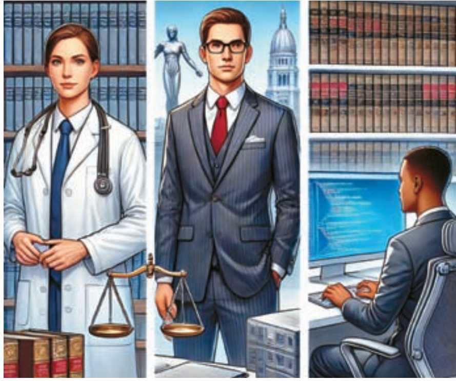
미국에서 대학원 학위 이상을 받고 10만달러 이상의 연봉을 받는 직업중 가장 많은 것은 역시 의대나 전문직들이 상당수였다. 이외 법률, 엔지니어링, 컴퓨터 분야에서 고객 연봉자들이 발견된다. [헛GPT생성]

연봉 10만달러 이상 직업 이민 가정들의 자녀 교육 목표는 대개 미국 이민사회에서 확실한 성공이다. 물론 성공에는 여러가지 방향과 업종이 있을 수 있다. 그중 가장 쉽고 계량적으로 확인이 가능한 것이 연봉이다. 법률, 의학, 기술 등 일부 분야에서는 석사 이상의 학위를 취득하면 10만달러 이상의 연봉을 받는다.