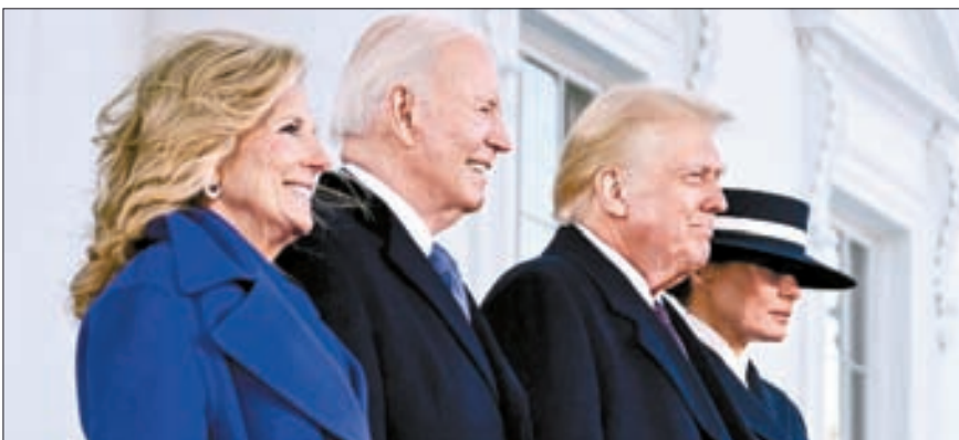
도널드 트럼프 대통령(오른쪽 둘째)과 부인 멜라니아가 20일 취임식에 앞서 백악관에 도착해 조 바이든 전 대통령(왼쪽 둘째) 부부와 함께 포즈를 취하고 있다.

두 부부는 회동을 마친 뒤 의사당 취임식장으로 이동한다. 취임식은 이날 오전 11시30분께 시작될 예정이며 트럼프 당선인의 임기는 이날 정오(한국시간 21일 오전 2시)부터 시작된다. 현직과 차기 대통령 부부 회동에 앞서 카말라 해리스 부통령 부부도 백악관에서 JC 밴스 부통령 당선인 부부를 맞이했다.