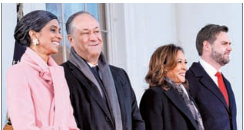
JD 밴스 미국 부통령(오른쪽)이 20일(현지시간) 워싱턴DC 백악관에서 카말라 해리스 전 부통령(오른쪽 둘째)과 포즈를 취하고 있다. 오른쪽 사진은 취임식 생중계를 보기 위해 워싱턴 ‘캐피털 원아레나’ 앞에 줄을 선 트럼프 지지자들.

트럼프 대통령은 “미국 쇠퇴의 막이 내리고 미국의 힘과 번영, 존엄과 자긍심의 새로운 날이 시작된다”고 백악관 재임성을 알렸다. 그는 전날 워싱턴 DC 대형 실내 경기장 ‘캐피털 원 아레나’에서 열린 대선 승리 집회에서 “워싱턴의 실패하고 부패한 정치권, 행정부의 통치를 단숨에 끝낼 것”이라며 이렇게 말했다. 이어 취임 즉시 ‘트럼프 스톱’이 몰아칠 것임을 시사했다. 트럼프 대통령은 “역사적인 속도와 힘으로 행동하고 미국이 직면한 모든 위기를 해