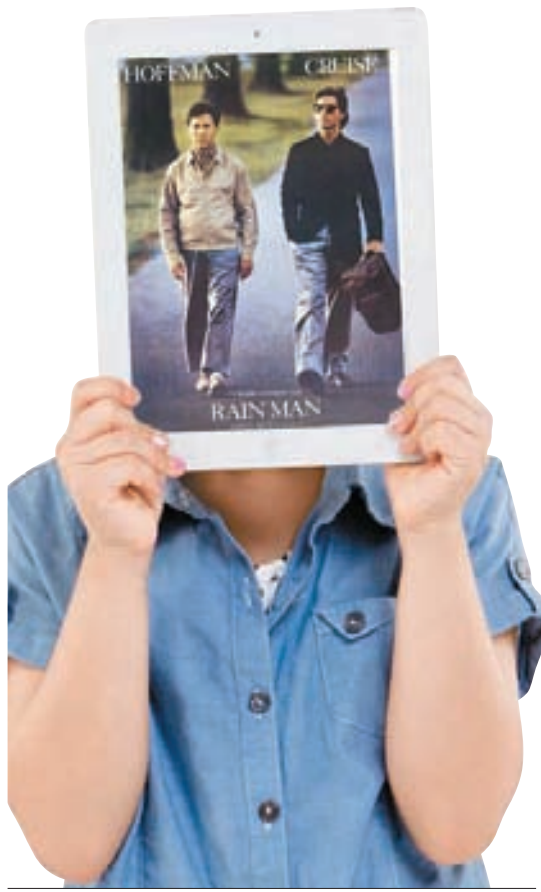
영화 '레인맨'은 실제 자폐증을 가지고 있는 '킴 피크'를 모델로 제작됐다.