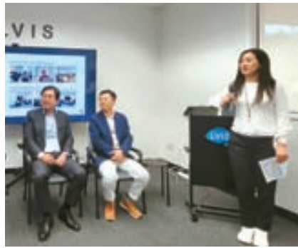
이진형(오른쪽 첫번째) 스탠퍼드 의대·공대 종신 교수가 지난해 엘비스 사옥에서 열린 '팔로알토 리더십포럼'에서 발언하고 있다.

직업의 안정성은 낮아졌지만, 잠재력은 커졌다. 특히 미국 테크산업이 그렇다. 공격력 대표는 “미국의 중국 견제가 심화되며 인터넷 인프라 사업분야에서 중국기업이 대거 빠져나갔다”며 “트럼프 2기엔 해외기업 견제가 더