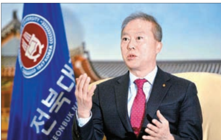
양오봉 전북대 총장은 17일 중앙일보와 인터뷰하며 “나고 자란 이 지역에서 일하고 경험했던 모든 경험과 노하우를 살려 글로벌대학30 사업에서 좋은 성과를 낼 것”이라고 말했다.

①양오봉 전북대학교 총장 2차전지·방산 관련 인재 집중 육성 학사·연구 등 ‘AI 통합시스템’ 도입 2028년 외국인 학생 5000명 목표