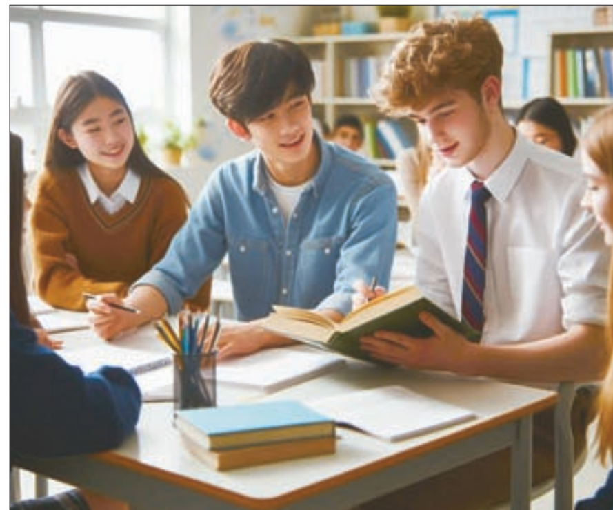
독서 토론이 독서 이해력을 높히는데 효과가 입증된 좋은 방법이다.

독해 이해력을 높이는 전략 지난 주에는 습관, 독서습관을 언제 들여야 하는지 알아봤다. 하지만 자녀들이 단어를 읽을 수 있다고 해서 그 단어를 완전히 이해한다는 것은 아니다. 독해 이해력을 높이는 전략을 알아봤다.