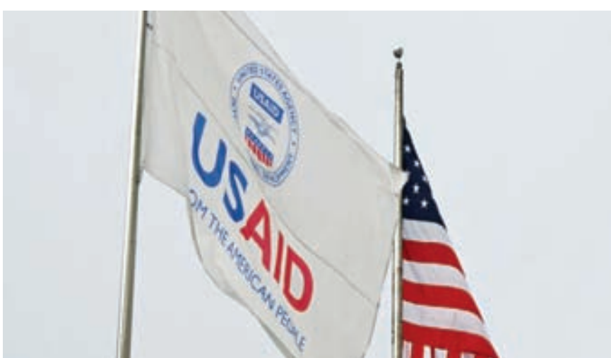
3일부터 폐쇄된 워싱턴DC에 위치한 연방국제개발처(USAID) 본부