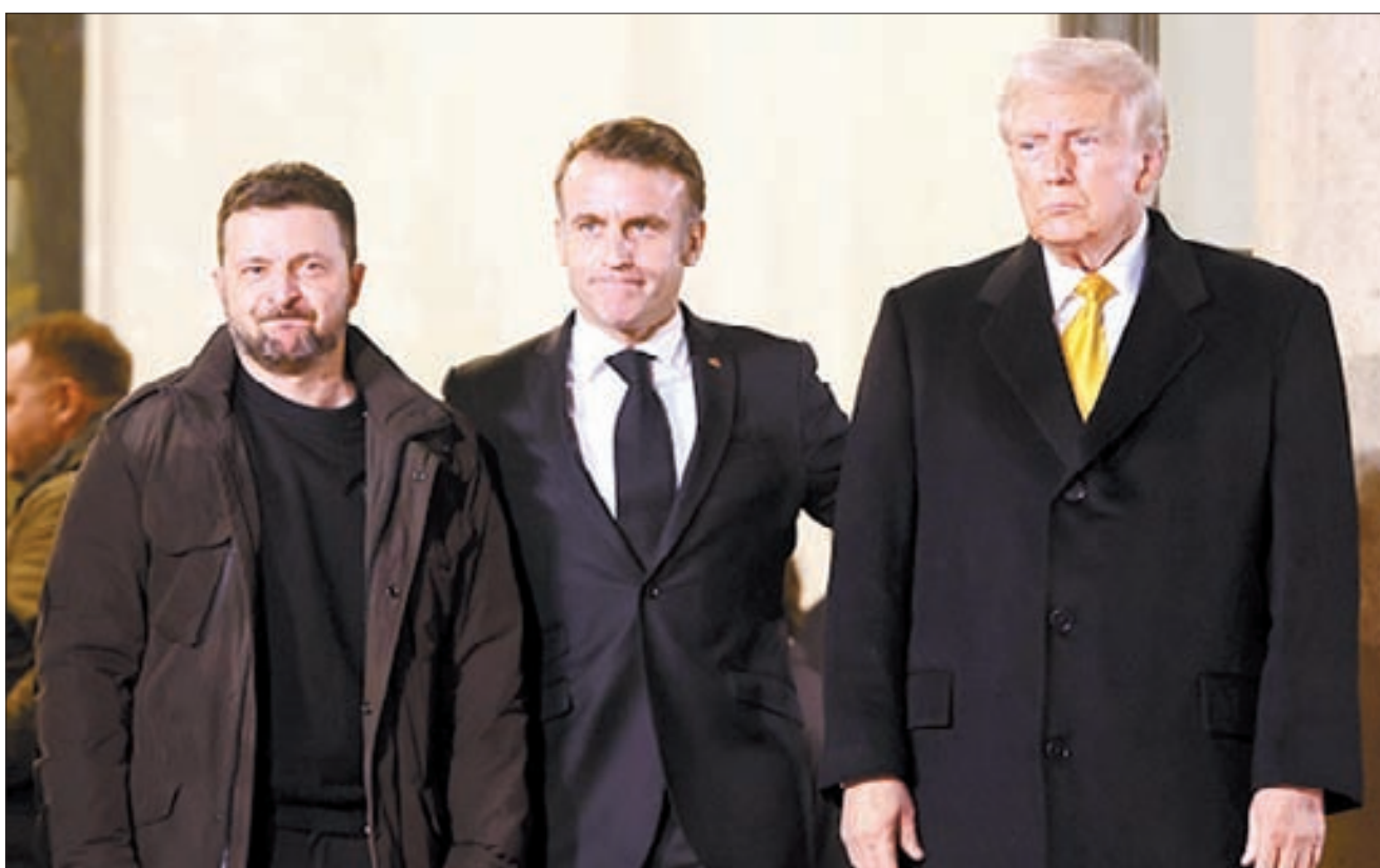
에마누엘 마크롱 프랑스 대통령(가운데)의 주선으로 지난해 12월 파리에서 종전 방안을 협의한 도널드 트럼프 미국 대통령 당선인(오른쪽)과 블로디미르 젤렌스키 우크라이나 대통령.

박노벽 전 러시아 대사의 설명(극동문제연구소 초빙교수·우크라이나 대사도 역임)은 이렇다. “종전 협상을 성공시키려면 러시아와 우크라이나의 입지가 대등해야 하는데 (전임 조 바이든 행정부 시기와 비교할 때) 미국은 우크라이나에 대한 무기 지원을 줄이면서