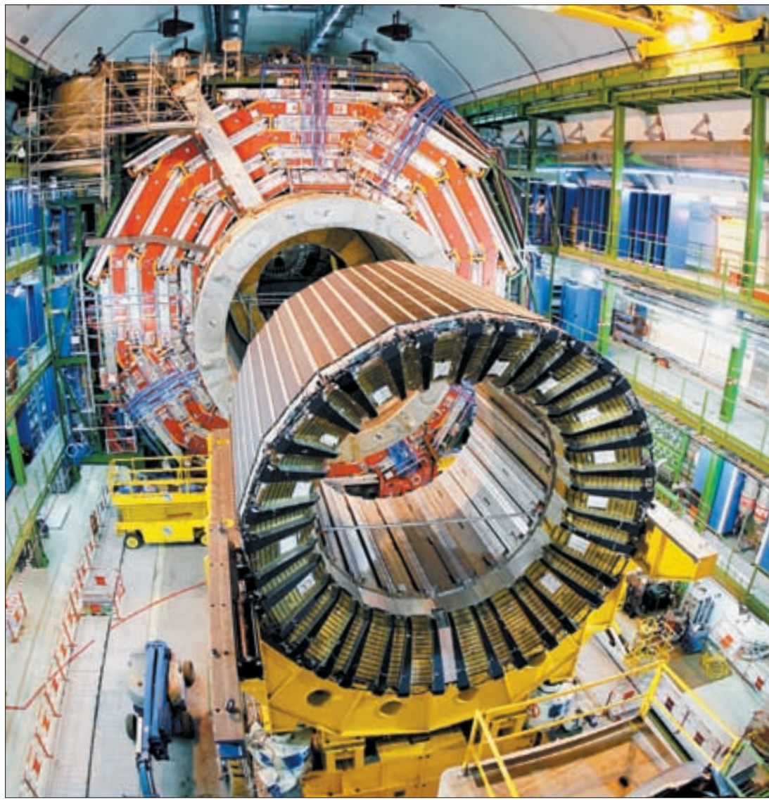
세계 최초로 힉스 입자의 존재를 증명하는 데 결정적 역할을 한 유럽입자물리연구소(CERN)의 뮤온 압축 솔레노이드(CMS) 검출기.

특히 영국 케임브리지대의 클라이브 오픈하이머 연구팀이 2010년대 초에 백두산 화산에 대해 직접 북한에서 연구를 진행하여 상세한 결과를 발표하면서 이런 주장은 더 설득력을 얻었다. 정작 남북 관계가 경색되는 바람에 가까운 남한 학자는 북한에 가서 화산 연구를 하지 못하고 있는데, 멀리 유럽의 영국 학자들이 북한에서 화산 연구를 할 수 있게 되었고 그 때문에 발해의 멸망이라는 한국사의 중대한 사건을 보는 시각이 바뀌게 되었다는 것은 생각해 볼수록 기막힌 일이다.