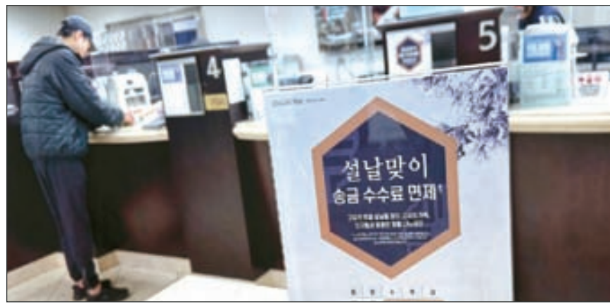
한인들의 설날 고국 송금 건수는 줄었지만 강달러로 송금 규모는 커진 것으로 나타났다. 김상진 기자

서 7.8% 감소했으나 총 송금액은 1698만 달러에서 11.8% 증가했다. 건당 송금액은 3041달러로 지난해의 2508달러보다 21.2%(533달러) 늘었다.