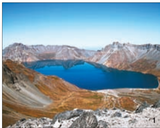
1 백두산 천지 모습. 10세기 후반 백두산 화산 폭발로 인해 발해가 멸망했다는 학설이 있다. 2 일본·프랑스 등 국제연구진이 뮤온 입자를 이용해 이집트 대피라미드 내부를 탐사하고 있다.

뮤온이 하늘에서 계속해서 내려온다는 말은, 우주에서 지구를 향해 X선 같은 역할을 하는 물질을 계속 쏘아 주고 있다는 것과 비슷하다. 그래서 과학자는 뮤온을 정밀 측정해서, 별도로 X선을 쏘아 주는 기계 없이도 하늘에서 저절로 /