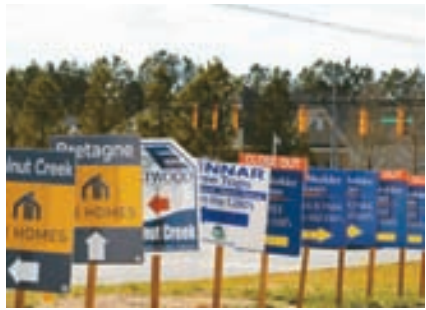
사우스 캐롤라이나주 주택가에 설치된 판매 안내 표지판.

주택 구매 붐이 일었던 3년 전의 35일과 비교하면 차이가 크다. 모기지 금리는 여전히 높다. 국책 모기지 기관 프레디맥에 따르면 30년 고정금리 모기지의 평균 금리는 지난달 30일 기준 전주 대