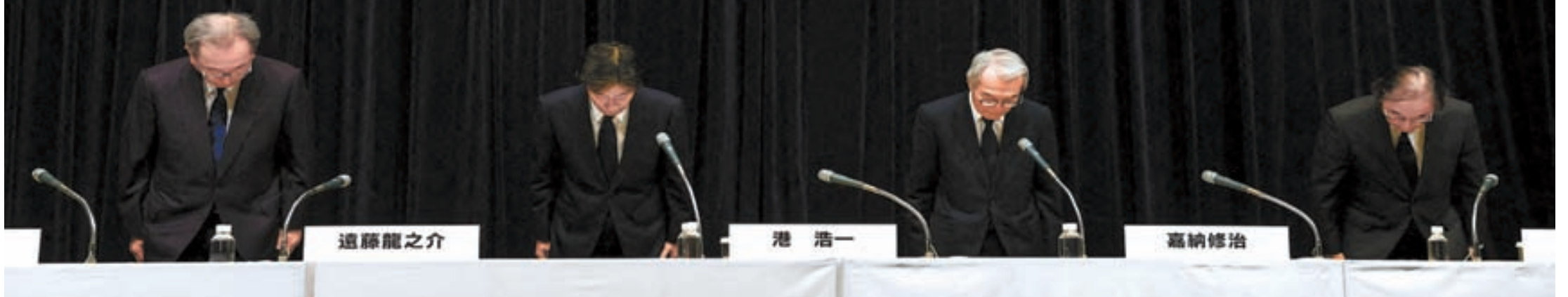
지난달 27일 후지TV 본사에서 열린 두번째 기자회견에 앞서 후지TV 임원단이 참석자들에게 머리 숙여 사죄하고 있다. 이날 회견에는 언론인 437명이 참석했다. 회견은 이튿날 새벽 2시까지 10시간 넘게 진행됐다.